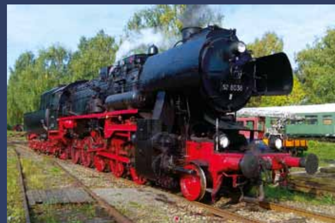
Dampflokomotive 52 8038 Dampfisenbahn Weserbergland e. V.

Henschel und Sohn Kassel 1923 | 100 km/h | 108 t | 1140 PS