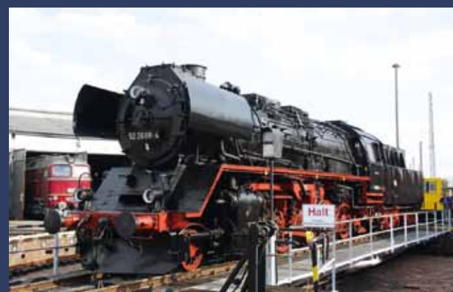
Dampflokomotive 50 3688 - 4 Förderverein Bahnbetriebswerk Arnstadt/historisch e.V.

Krupp Essen 1939 | 90 km/h | 162 t | 2000 PS