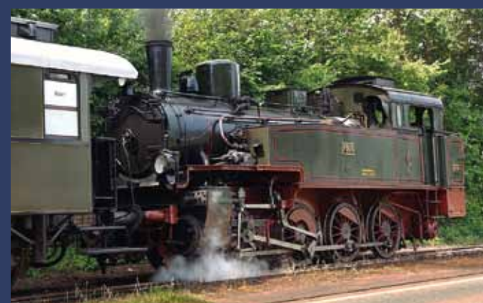
Stettin 7206 Museumseisenbahn Minden

Wiener Lokomotivfabrik Florisdorf 1942 | 80 km/h | 170 t | 1910 PS