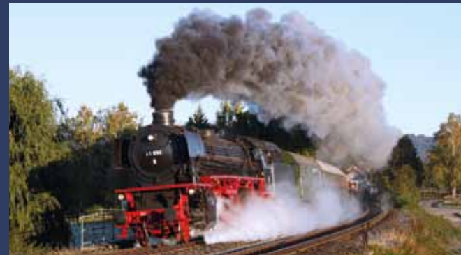
Dampflokomotive 41 096 Dampflokomotivgemeinschaft 41 096 e.V.

Union Gießerei Königsberg 1912 | 45 km/h | 57 t | 500 PS