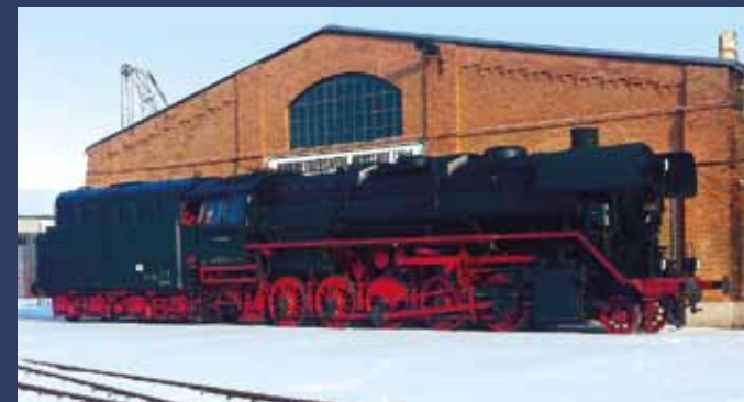
Dampflokomotive 44 0093 Förderverein Bahnbetriebswerk Arnstadt/historisch e.V.

Die Loks der BR 44 waren schwere, fünffach gekuppelte Einheitsdampflokomotiven für den Güterzugverkehr mit Drillingstriebwerk. Als „Arbeitselphant“ hat diese Type den Spitznamen „Jumbo“ erhalten. Auch in Osnabrück war die BR 44 sehr verbreitet. Die 44 0093 ist nicht betriebsfähig und wird als Ausstellungslok gezeigt.