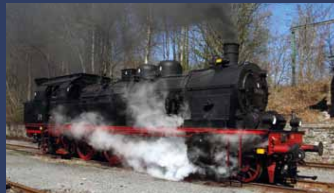
Dampflokomotive 78 468 Eisenbahn-Tradition e.V.

Die Baureihe 78 ist eine bewährte Type der ehemals königlich-preussischen Eisenbahnverwaltung (als T18) und wurde sehr häufig in Vorortverkehren in Ballungsgebieten eingesetzt. Sie ist die einzig erhaltene Lok der BR 78, die noch betriebsfähig ist.